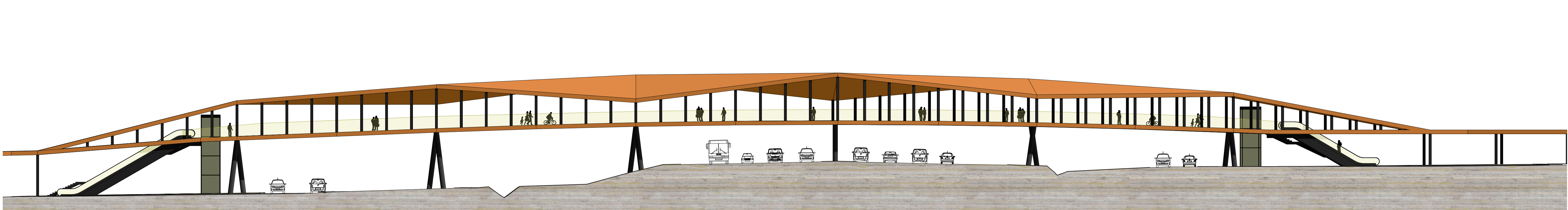
NYUGATI NÉZET M=1:250