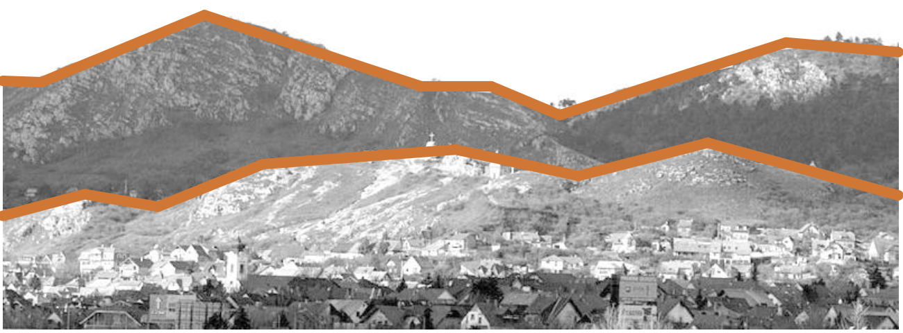
NÉZET DÉL FELŐL M=1:250