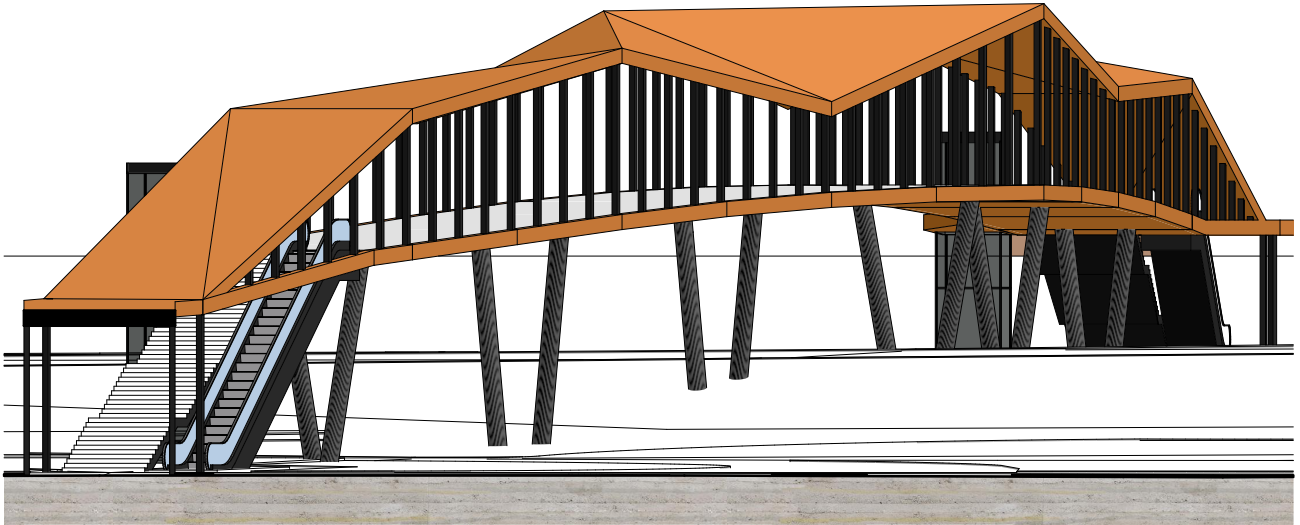
NÉZET ÉSZAK FELŐL M=1:250