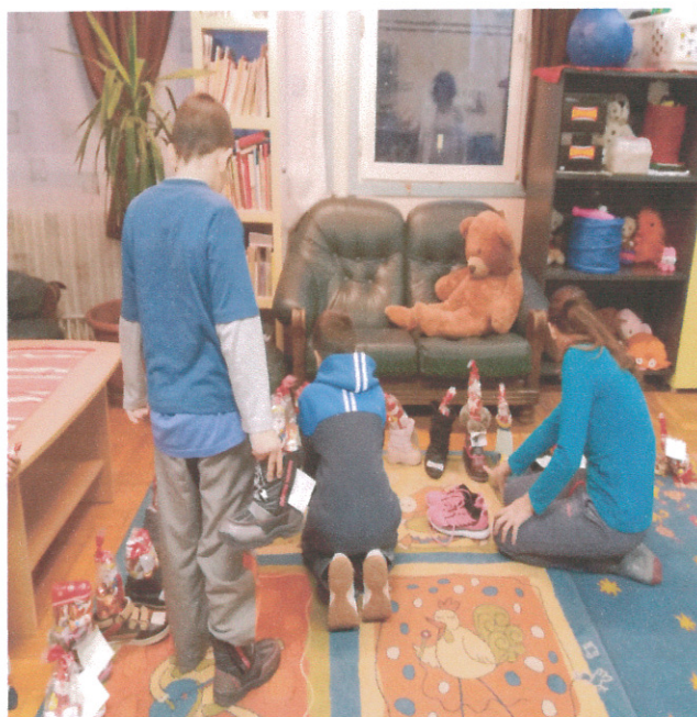
Van zsákodban minden jó...

Idén két Mikulás is ellátogatott hozzánk kedves segítő önkéntesek által. A gyermekek percről percre fokozódó izgalommal várták, meghallják-e a száncsengő hangját. A fiatalok félénkebben, a nagyobbak már bátrabban mentek az ajándékért, és énekeltek, verset mondtak a nagyszakállú Mikulásnak.