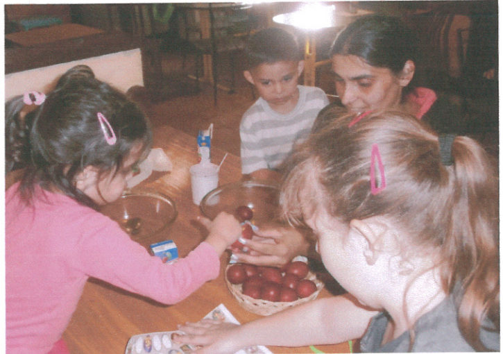
Húsvéti tojásfestés anyával