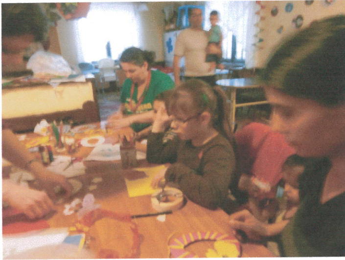
Készülnek a húsvéti díszek a falra

Fontosnak tartjuk, hogy a családok minél inkább sajátjuknak érezzék az ünnepet, ezért igyekszünk minél nagyobb szerephez juttatni a szülőket. Felügyelettel és segítséggel ugyan, de a szülők feladatává válik az várakozásban való aktív részvétel: az előkészületek, a díszítésben való segédkezés, a finomságok elkészítése is. Mindezt azért, hogy a gyerekekkel való örömteli együttlét megéléséhez vezessük el a családokat.