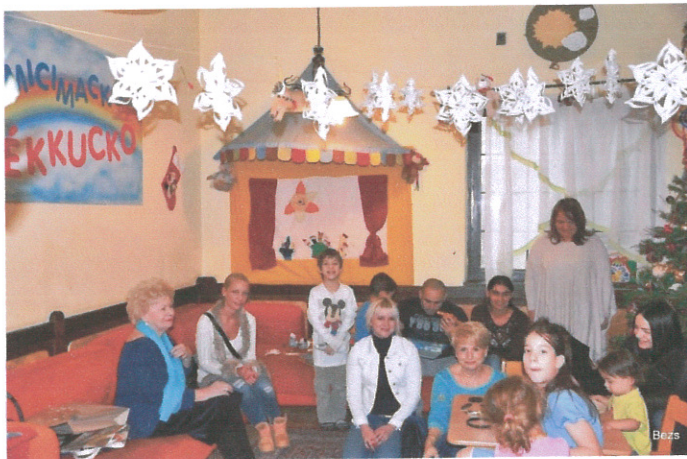
A Boldogság Klub látogatása

Boldogság Klub látogatott el hozzánk, akik az örömteli együttléten túl élelmiszer adománnyal is támogatták családjainkat. A gyerekek pedig énekeltek és táncoltak a vendégeknek. Az együtt lét olyan jól sikerült, hogy a továbbiakban rendszeressé kívánjuk tenni.