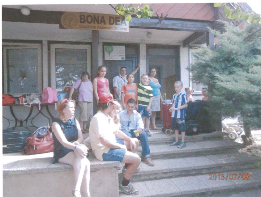
Intézményünk kapuján belépve lakóink otthonra lelnek

Intézményünk megközelíthetősége kiváló, ami a munkába járást könnyíti meg lakóink számára. Ez nem csupán abból ered, hogy Érd és Diósd a főváros vonzáskörzetében található, hanem fontos tényezőként otthonunk közel van az M7-es autópályához, illetve a 70-es úthoz amin közlekedő buszjárat gyakran és gyorsan juttatja el lakóinkat Budapestre, valamint a közeli településekre. Óvoda, iskola, bolt, felnőtt és gyermekorvosi rendelő, gyógyszertár, posta, stb. van az intézmény közelében.