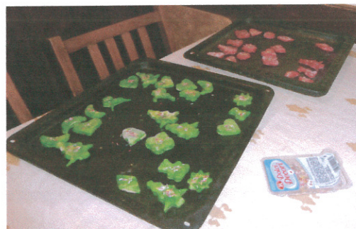
Az elkészült gyermeki finomságok☺