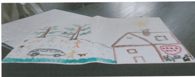
Az álom valósággá válhat

A családoknak lehetőséget nyújt a nálunk eltöltött idő arra, hogy mind mentálisan, mind anyagilag megerősödjenek.