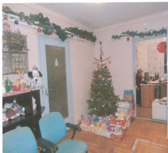
Pest Megyei Kormányhivatal munkatársai gyűjtöttek ajándékot.

Nagy öröm számunkra, hogy ilyenkor milyen sokan gondolnak ránk. Az idén több szervezet, magánszemély, iskola is megkeresett minket, hogy megajándékozza lakóinkat kedves mosollyal, finomságokkal, étellel és odafigyeléssel.