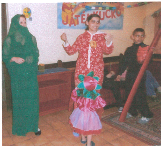
A felnőttek is beöltöztek

A farsang a bolondozások és a tánc ideje. Ilyenkor a szülők is bátrabban kerülnek vicces szituációkba: beöltöznek és együtt játszanak a gyermekekkel.