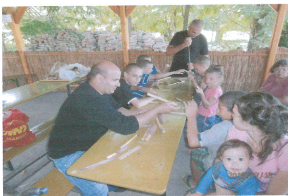
Népi hangszer készítés

A felnőttek sem maradnak ki a közösségi életből. Közös főzésekkel, szülői fórumokkal, az ünnepek megtartásával, az előkészületekben és az eseményeken való aktív részvétellel erősödik az „együtt” érzése, így formálódnak a családok lakóközösségé. Támogatjuk a családok minden olyan kezdeményezését, ami a közösségi életet erősíti.