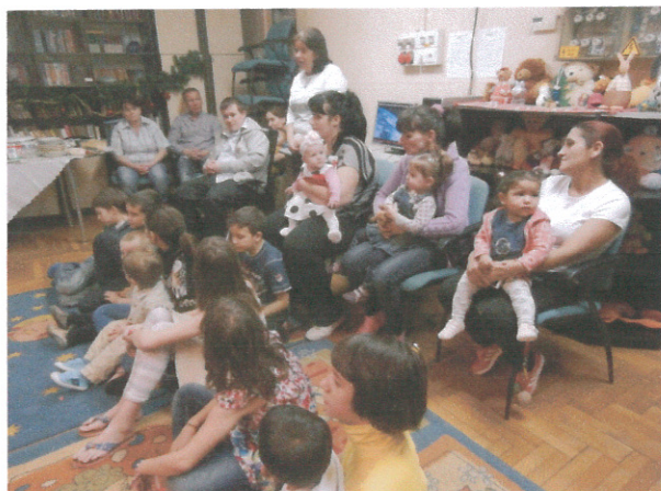
közös karácsonyi ünnep

A karácsonyi előkészületekből kicsik és nagyok egyaránt kivették a részüket. Tervezték, díszítettek, a gyerekek műsorral készültek és közösen főztek. Még az apróságok is komoly arccal szaggatták a süteménytészta a nagy napra.