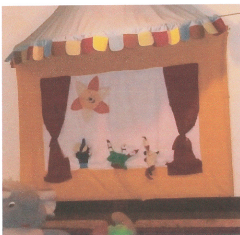
Szülők által varrt bábszínház