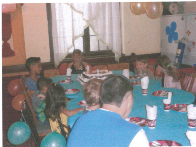
Együtt az asztalnál

Rendszeresen megünnepeljük a születésnapokat. A torta nemcsak az ünnepelt öröme☺