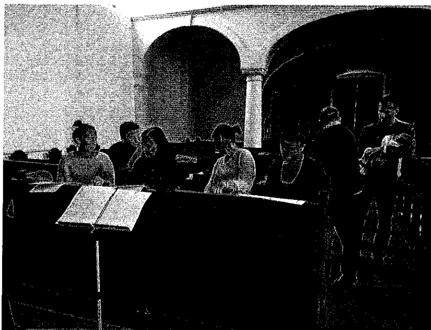
Kórustábor, a próba szünetében

Kórustáborunkat az idei évben a szokásostól eltérően szeptember végén tartottuk, szept. 21-23. között Csajágon. A korábbi években bevált próbahelyünket, a falu Művházát idén nem tudtuk igénybe venni rendezvény miatt, így a Református templom lelkésze sietett a segítségünkre, felajánlva a templomot próbáink helyszínéül. A próbák mellett egy kis kikapcsolódásra, közösség építésre is alkalmat adott ez a hétvége.