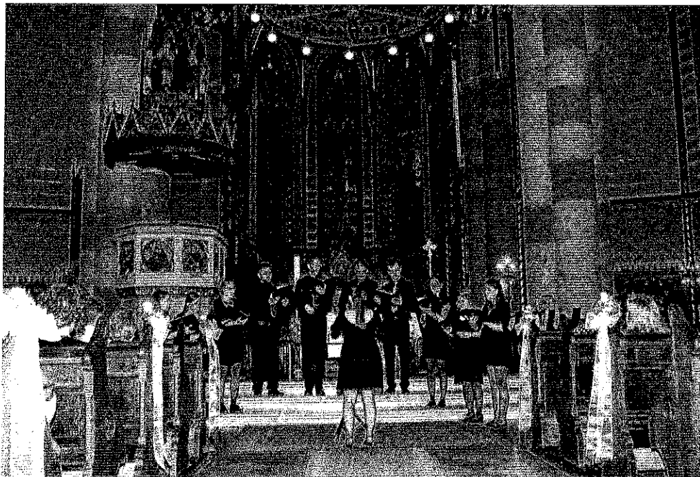
Vándor-Révész fesztivál, templomi koncert

Tavasszal részt vettünk egy szakmai fesztiválon is: a budapesti V. Vándor-Révész Fesztivál és III. Nemzetközi Kórusverseny fesztiváleseményei keretében 2 koncertet adtunk: május 12-én délelőtt a Szent István Parkban világi műsorral, este az Árpádházi Szent Erzsébet Plébániatemplomban egyházi műsorszámainkkal mutatkoztunk be a közönség és a többi kórus előtt. Mindkét koncertünk után pozitív visszajelzéseket kaptunk a szakmai résztvevőktől is. ✓