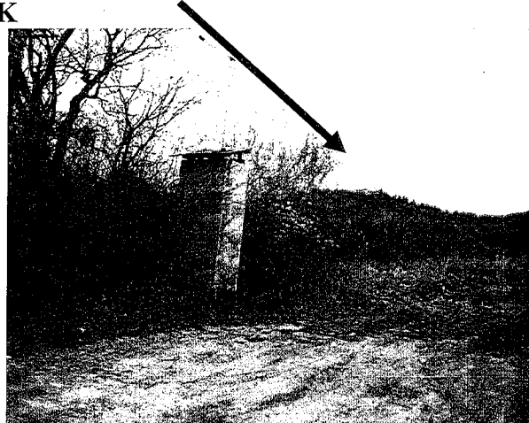
telek és környezet