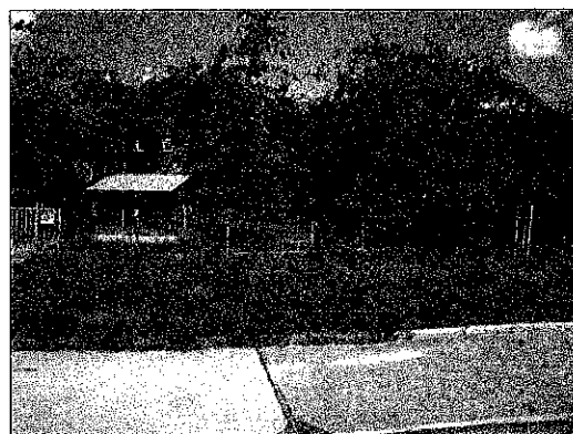
Csatorna műtárgy a szomszéd telken