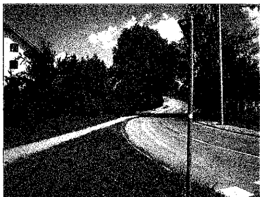
4733/1 hrsz terület DK-i oldal