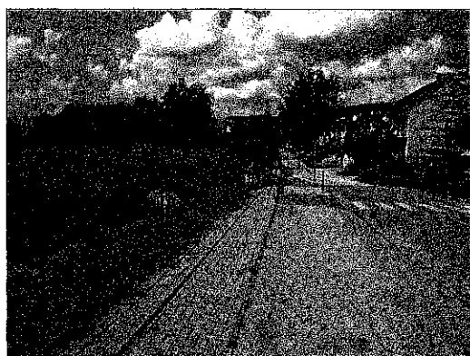
Utcakép Budafoki u.